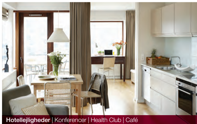
Hotellejligheder | Konferencer | Health Club | Café